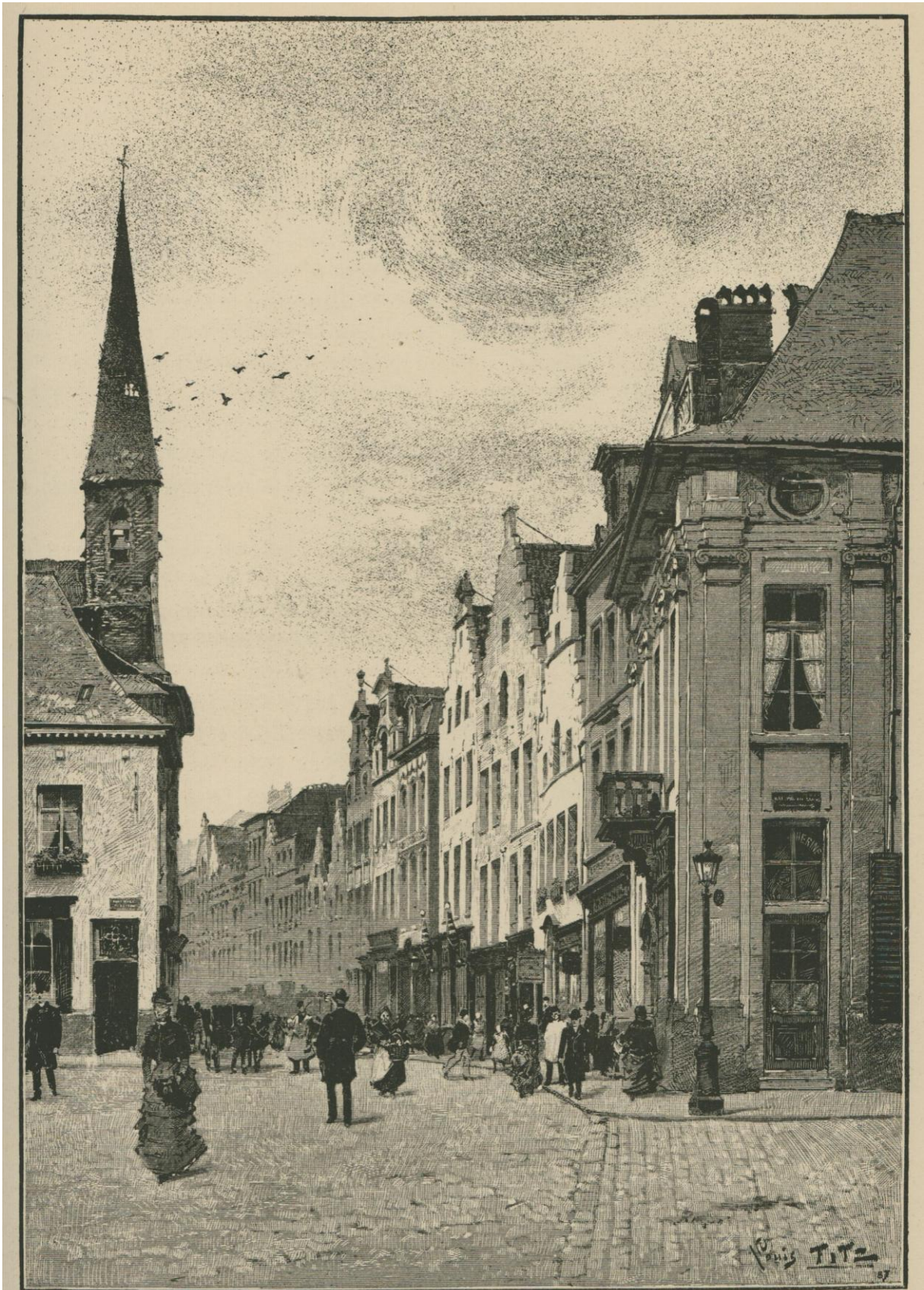
LA RUE SAINTE-CATHERINE. Dessin original de Louis Titz.